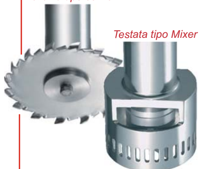
Testata tipo Mixer