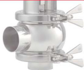
Principio di funzionamento