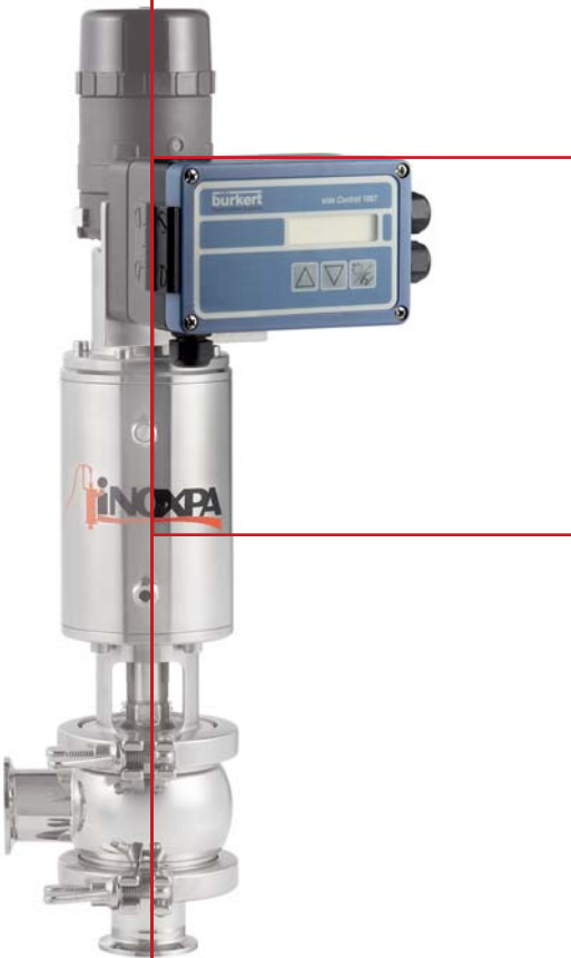
Eje porcentual de regulación