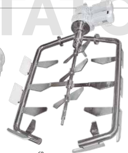
CR Agitador contra-rotación Counter-rotating agitator