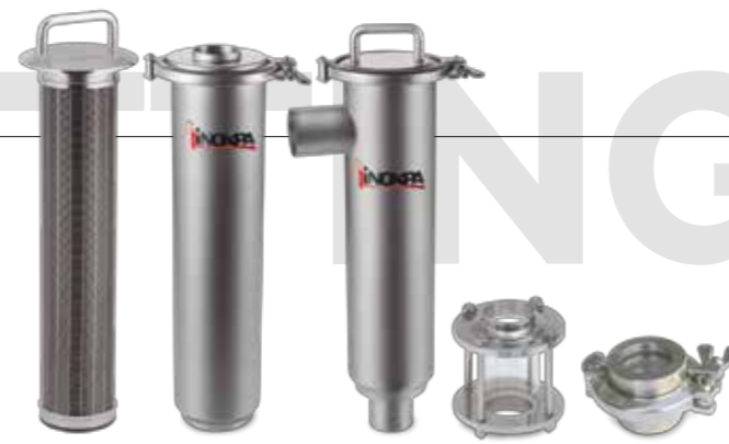
Filtros y mirillas Filters and sight glasses