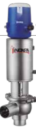
Tipo N N type