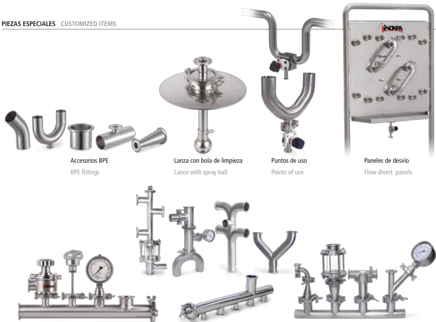
Accesorios BPE BPE fittings