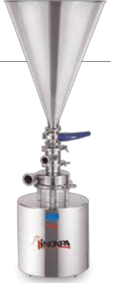
M-226 Mezclador sólido-líquido Solid-liquid blender