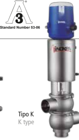
Tipo K K type