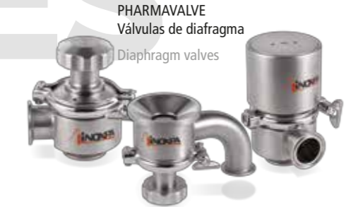
PHARMAVALVE Válvulas de diafragma Diaphragm valves