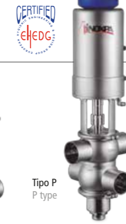
Tipo P P type