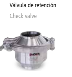
Válvula de retención Check valve