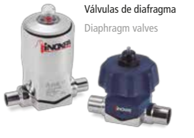
VEEVALV Válvulas de diafragma Diaphragm valves