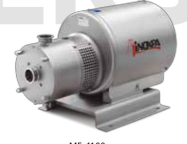
ME-4100 Mixer en línea In-line mixer