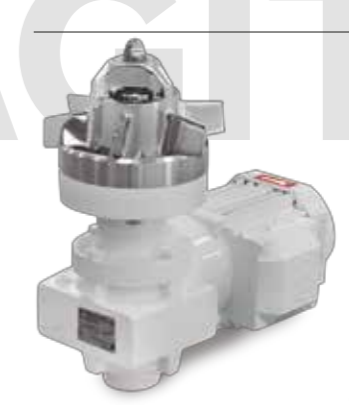
Agitador magnético BMA Magnetic agitator BMA