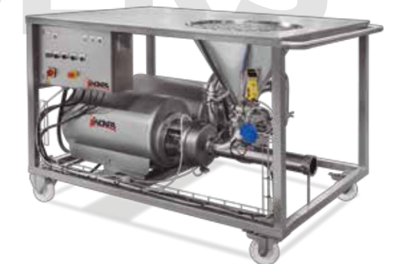
Mezclador horizontal de mesa Horizontal table blender