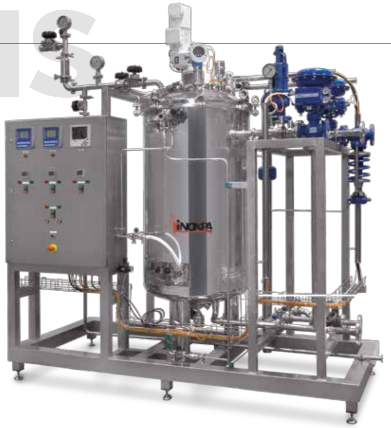
Reactores para preparación de soluciones inyectables. Incluye instrumentación, agitador, cuadro eléctrico y de control y videoregistrador Reactors for preparation of solutions for injections. Includes: instrumentation, agitator, control panel and video recorder