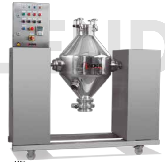
MBC Mezclador tipo bicono Equipo para la realización de mezcla homogénea de sólidos Double cone solids blender Skid designed to produce homogeneous solid-solid mixture