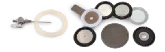
Juntas para uso farmacéutico. Certificadas FDA y USP. Clase VI-XXII Pharmaceutical gaskets. FDA and USP certified. Class VI-XXII certification