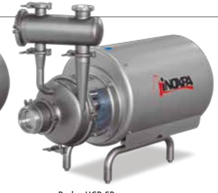
Prolac HCP-SP Bomba autoaspirante Self-priming pump