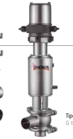
Tipo G G type