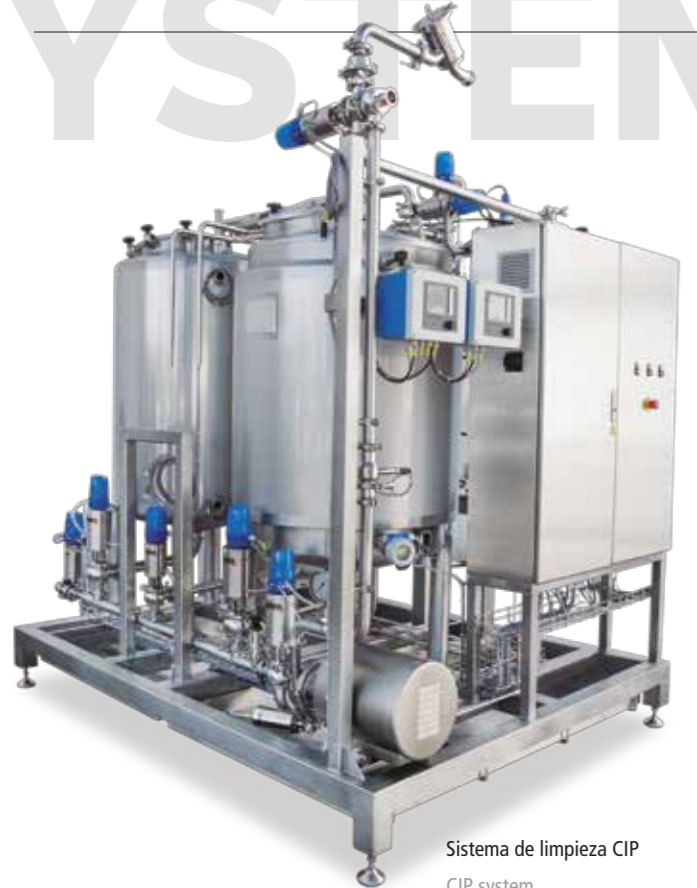
Sistema de limpieza CIP CIP system