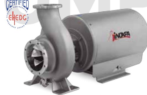
DIN-FOOD Bomba centrífuga Centrifugal pump