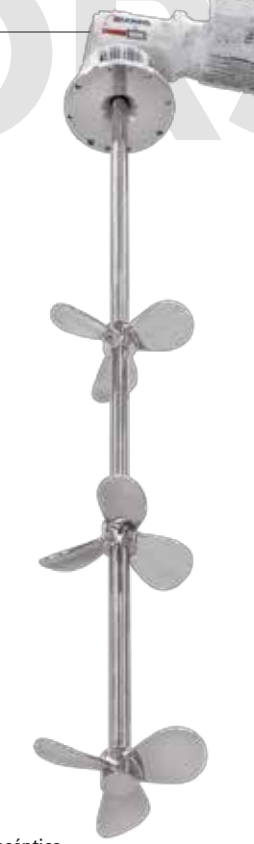
Agitador aséptico con hélices marina Aseptic agitator with marine propeller