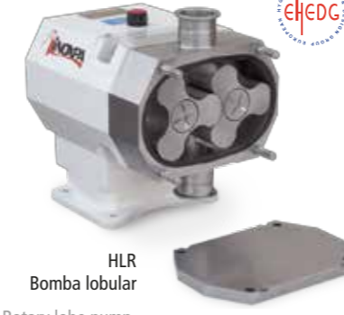
HLR Bomba lobular Rotary lobe pump