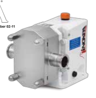
SLR Bomba lobular Rotary lobe pump