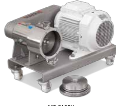
ME-8100X Mixer multidientes Multitooth mixer