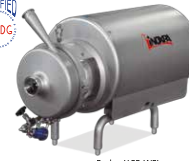
Prolac HCP-WFI Bomba centrífuga Centrifugal pump