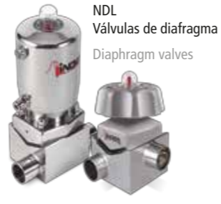
NDL Válvulas de diafragma Diaphragm valves