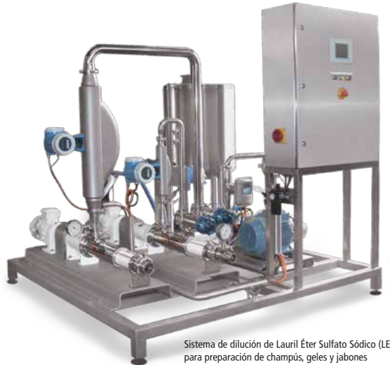
Sistema de dilución de Lauril Éter Sulfato Sódico (LESS) al 26% para preparación de champoos, geles y jabones Dilution system of Sodium Laureth Sulfate (SLES) to 26% for preparation of shampoos, gels and soaps