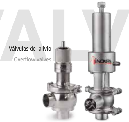
Válvulas de alivio Overflow valves