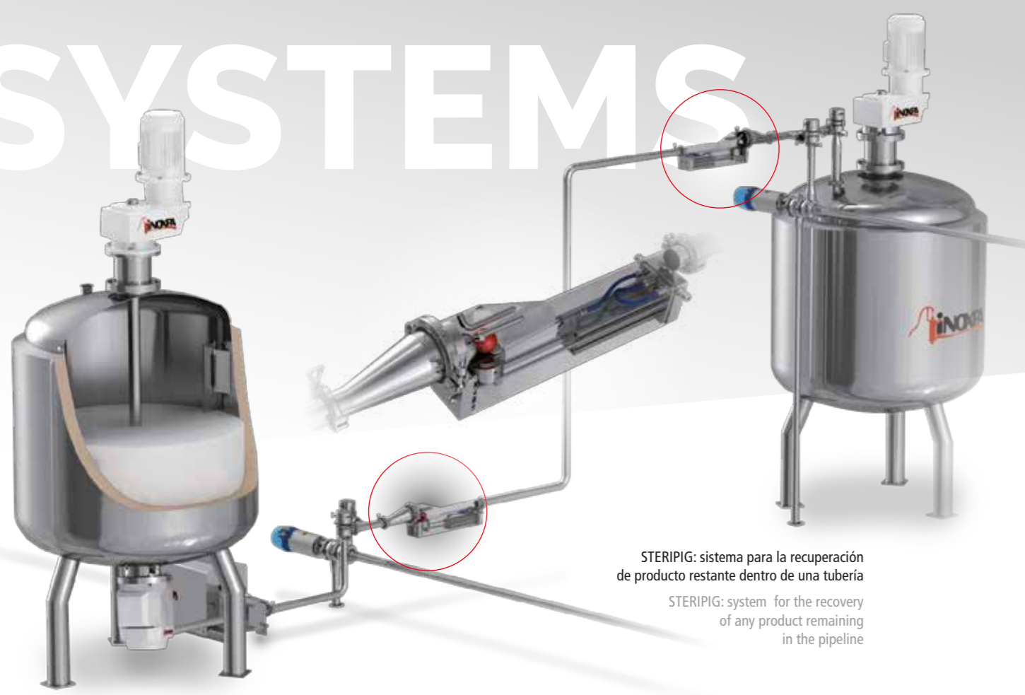
STERIPIG: sistema para la recuperación de producto restante dentro de una tubería

STERIPIG: system for the recovery of any product remaining in the pipeline