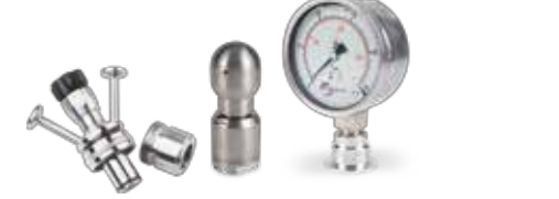
Grifos tomamuestras asepticos, bolas de limpieza y manómetros Aseptic sampling valves, spray balls and pressure gauges