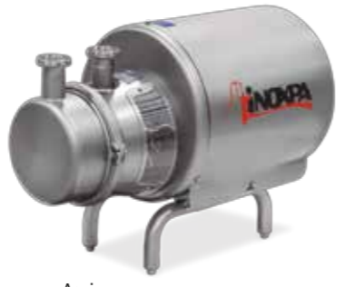
Aspir Bomba autoaspirante Self-priming pump