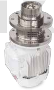
ME-6100 Mixer de fondo Tank bottom mixer